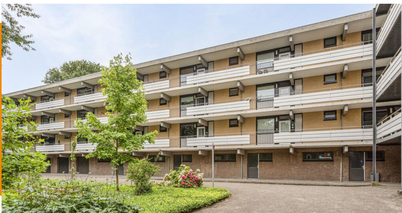
CAMPANULA 116 • DORDRECHT