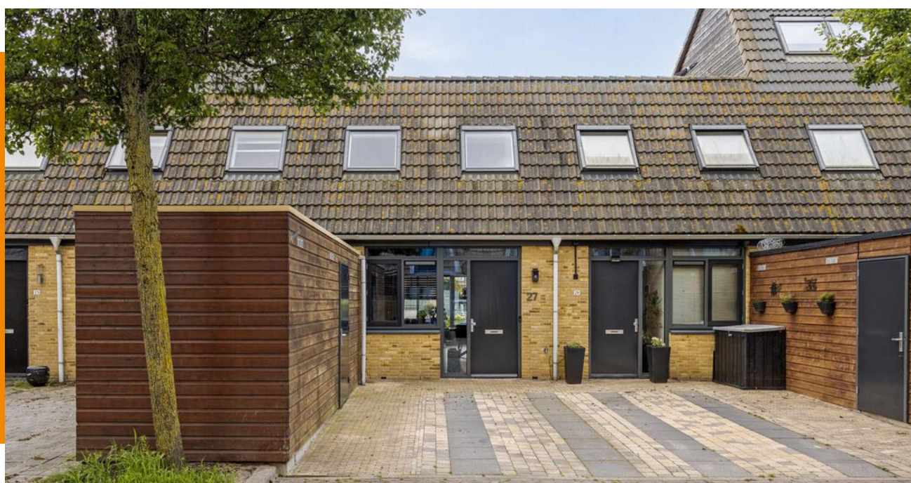
WINDHALM 27 • HENDRIK-IDO-AMBACHT