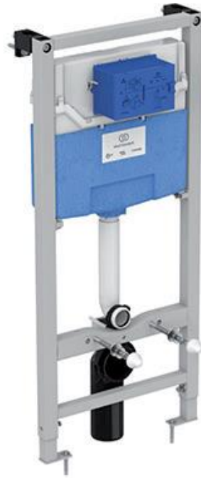
Ideal Standard Inbouwreservoir