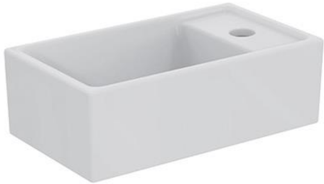
Ideal Standard Fontein 37cm x 21 cm met kraangat rechts, wit