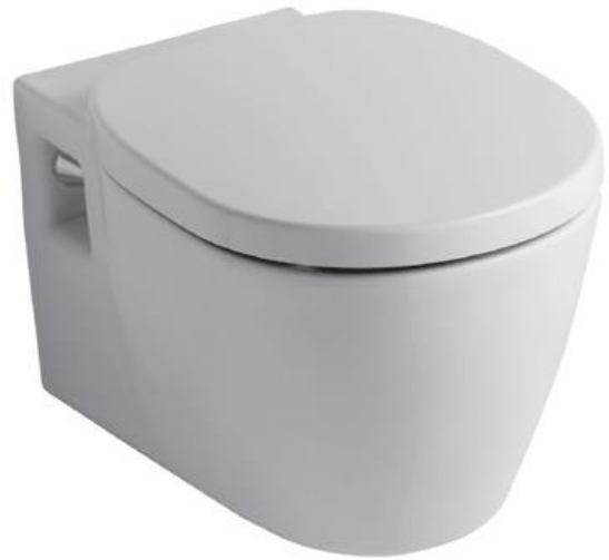
Ideal Standard Wandcloset, diepspoel met duroplast zitting en deksel met RVS scharnieren, wit