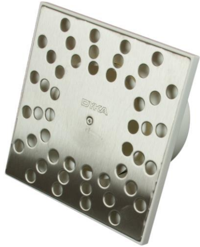
Doucheput met RVS rooster 15 cm x 15 cm