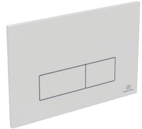
Ideal Standard Bedieningspaneel Oleas M2 wit