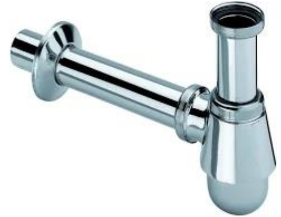
Viega Plugbekersifon met muurbuis en rozet, chrom