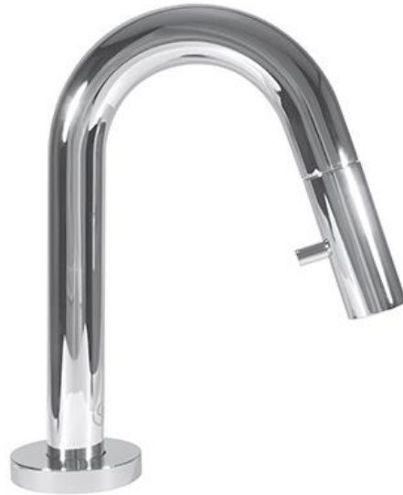
Ideal Standard Koudwaterkraan 6 l/min met hoge uitloop en geïntegreerde bediening in chrom