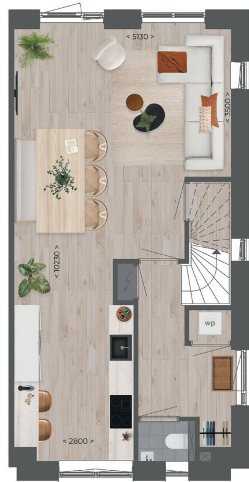
Afgebeeld: bouwnummers 40 en 48 Gespiegeld: bouwnummers 47 en 54