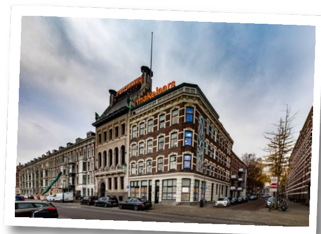
Maaskade 113, 3071 NJ Rotterdam

Informatie aanvragen of bezichtiging plannen? Bel: 010 - 424 8 888